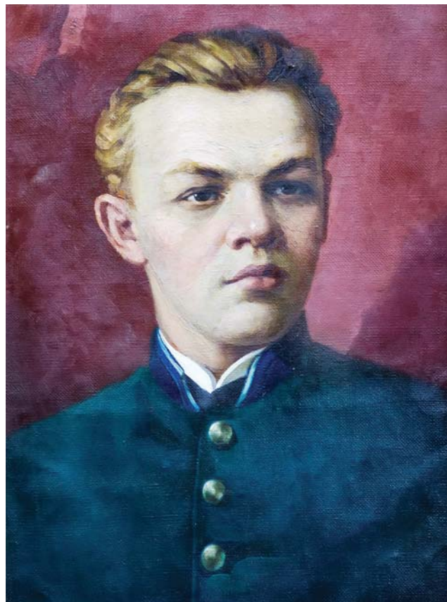
В. Ульянов. Худ. Симбирин Е. А., 1887 г.