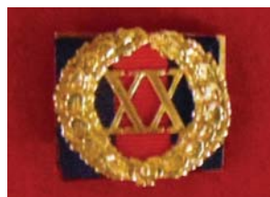
Знак Отличия беспорочной службы

Музейные экспозиции рассказывают и о родителях Владимира Ильича. Его мать, Мария Александровна Бланк, жила в Кокушкино с 12 до 28 лет, часто бывая в Казани. Она получила отличное домашнее образование: свободно владела иностранными языками (немецким, французским и английским), хорошо знала российскую и зарубежную литературу, играла на фортепиано, могла вести светскую беседу и домашнее хозяйство. Личные предметы Марии Александровны включены в мемориальную коллекцию музея и напоминают об удивительной женщине. Как мать, она боялась за детей, не всегда разделяя их убеждения. Но, переступив через свои волнения и переживания, совершила великий материнский подвиг, на который способна не каждая женщина, – она согласилась с жизненным выбором своих детей, стала надежным другом и помощником на всю жизнь.