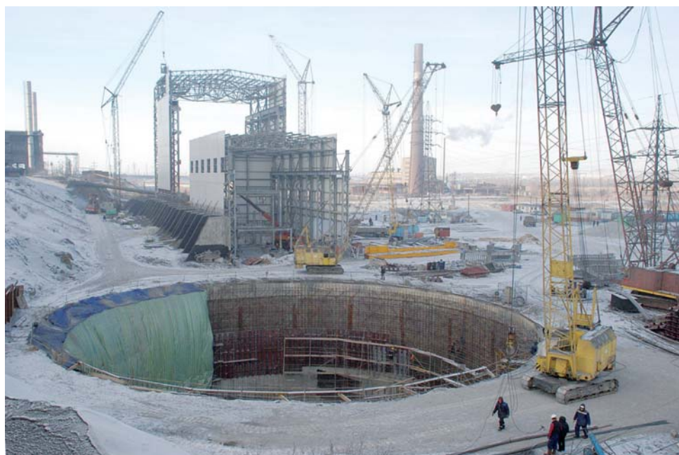
ДОФ-2. Строительство опускного колодца

Казахстан и металлургия неразрывны: именно металлурги наряду с нефтяниками в основном пополняют государственную казну. Горно-металлургический комплекс дает 11 % общего объема ВВП. Президентом страны Н. А. Назарбаевым поставлена важная задача по вхождению Казахстана к 2016 г. в группу стран с высоким уровнем дохода. Главным инструментом ее реализации является Программа форсированного индустриально-инновационного развития. В ней предъявляются высокие требования к экономике проектов. Главные критерии отбора участников — технологичность производств и востребованность продукции на мировом рынке. В Карте индустриализации Казахстана включены и проекты СГПО.