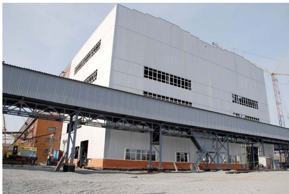
Фабричный комплекс. Технологическая линия № 17

Вот эта плеяда высококвалифицированных инженеров и специалистов не дала погибнуть Соколовско-Сарбайскому горно-обогатительному комбинату в годы так называемой перестройки и в годы перехода экономики на рыночные рельсы. Становление рыночных отношений проходило в сложнейших условиях и сопровождалось колебаниями цен, валютного курса,