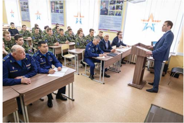
Рис. 5. Доклад в Военном учебном центре Тверского государственного технического университета

Поиск способов преодоления масштабных вызовов в условиях распада однополярного мира, с которыми, наряду с остальными отраслями экономики, столкнулась и горнодобывающая отрасль России, потенциально может иметь более высокую эффективность, если обратить взгляд к истории, обнаружив точки взаимопроникновения горного и военного дела. Как показано в настоящей работе, это прослеживается через историю основания «Горного журнала». Такой подход может стать отправной точкой выделения базовых принципов, которыми должны руководствоваться трудящиеся