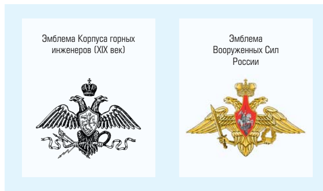
Рис. 1. Схожие элементы в геральдике Корпуса горных инженеров и Вооруженных Сил РФ

2025 год является знаковым: это год и 80-летия Великой Победы, и 80-летия создания атомной отрасли 2 – исторически во многом взаимообусловленных событий. 200-летие