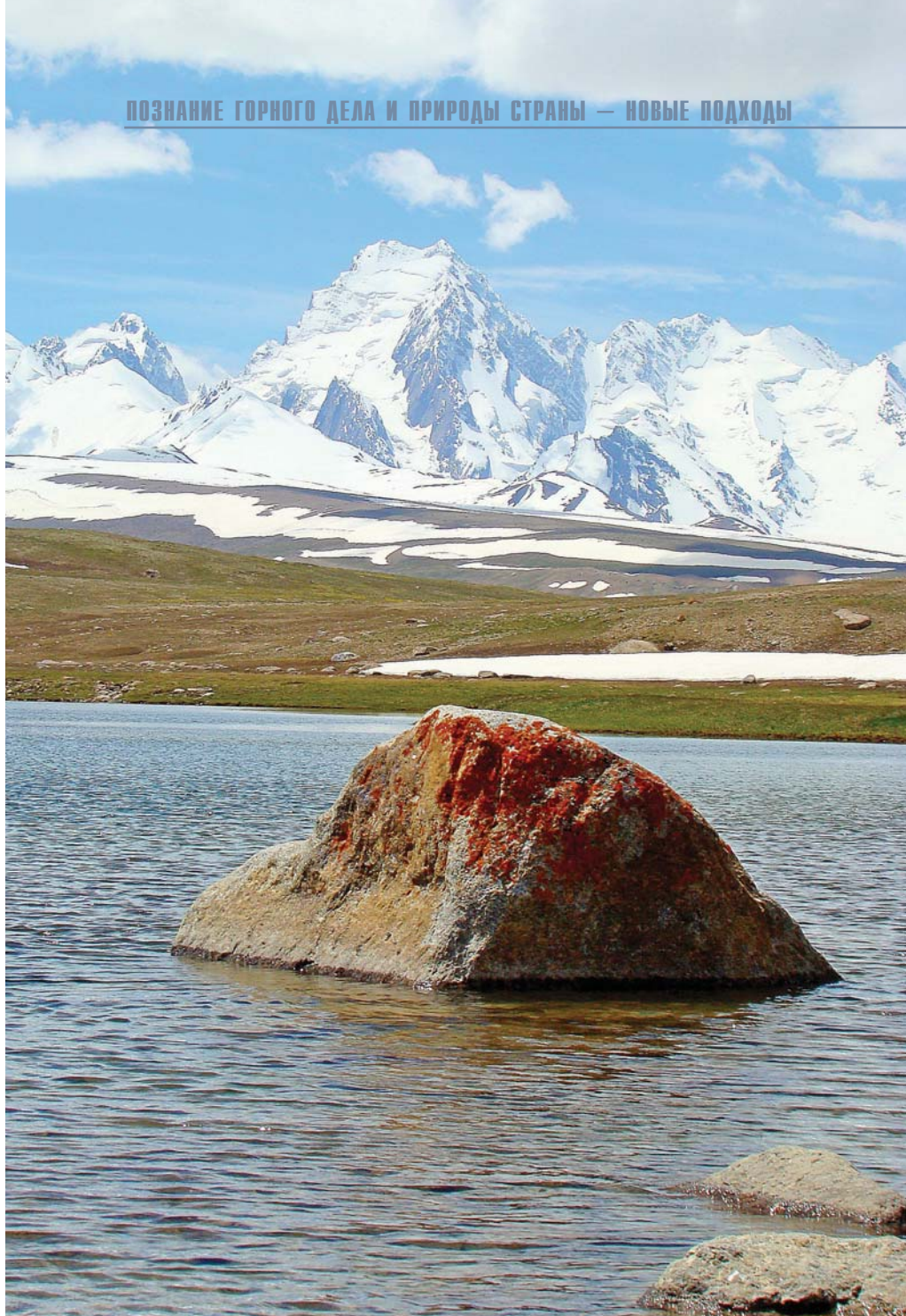
Кокшаал-Тоо, Нарынская область

Этап замедления («торможения») развития — с 2006 г. по настоящее время. Темпы роста отрасли, достигнутые к 2005 г., оставались довольно низкими, и не могли удовлетворить амбиции государства и оправдать надежды, возлагаемые на отрасль. В то же время у государства хоть и было понимание того, что же мешает качественному скачку отрасли, однако для преодоления возникших проблем ничего не делалось. А тут еще грянула «революция» 2005 г., которая в одночасье отбросила отрасль далеко назад. Целых пять лет понадобилось только для того, чтобы вернуться к рубежам 2005 г., как очередная «революция» 2010 г. опять отбросила отрасль далеко назад. Другим фактором прак-