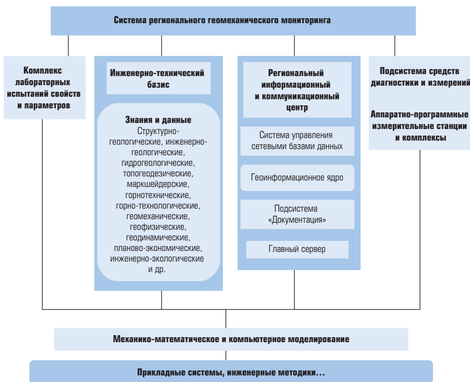
Рис. 1. Общая структура системы регионального геомеханического мониторинга