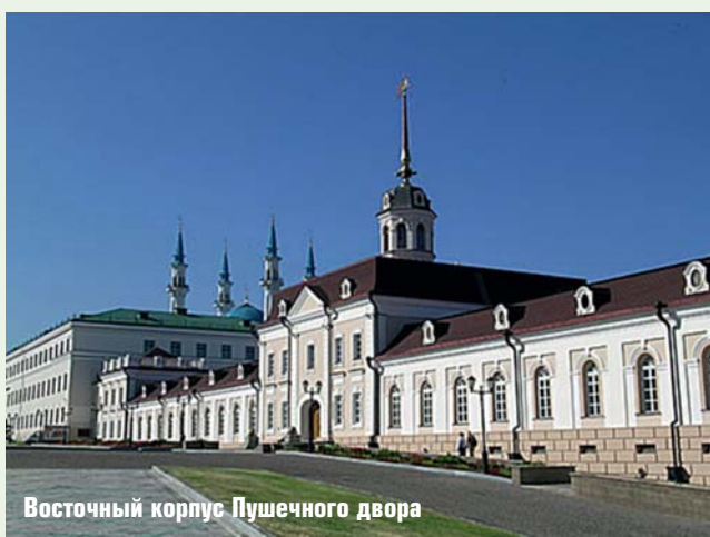
Восточный корпус Пушечного двора